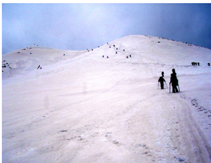
写真8 朝日岳の斜面を登る