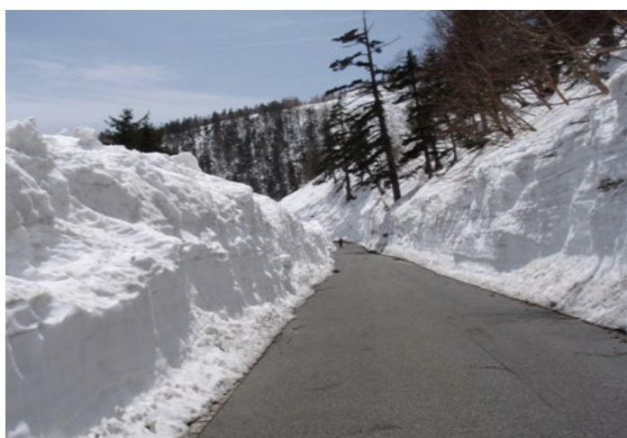
写真3 除雪回廊を位ヶ原山荘に向かう