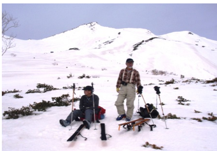
写真4 摩利支天をバックに位ヶ原にて