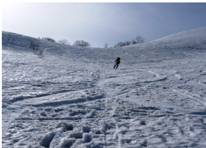
写真 5 ツアーコース入口の斜面

そのまま除雪されていない車道を辿って、位ヶ原に向けシール登高を開始した。年末に比べると、積雪は格段に豊富である。途中、山スキーのツアーコースの分岐点を確認して、一路、肩ノ小屋に向けて雪原を進む。しかし、先頭の笹川さんが待ちくたびれていたトイレ小屋（2610m）付近に最後の青景が到着したのが午後 3 時であった。本日はここまでとして、明日登頂を狙うことにする。ここから