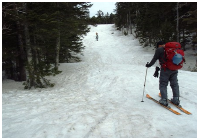
写真 6 ツアーコースのシール登高

リフトトップのカモシカ平には雪がたっぷり残っていた。ここから樹林帯を切り開いたスキーツアーコースに入る。コース入口の急斜面を登ってからシール登高を開始した。好調の笹川さんをトップにピッチを刻むが、青景は不調で徐々に取り残さ