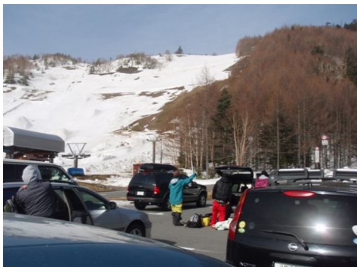
写真 1 三本滝駐車からグレンデを望む

予定通り 8 時に乗鞍高原スキー場の最上部の三本滝駐車場 (1820m) に着く。位ヶ原山荘まで除雪されているが、一般車はここ