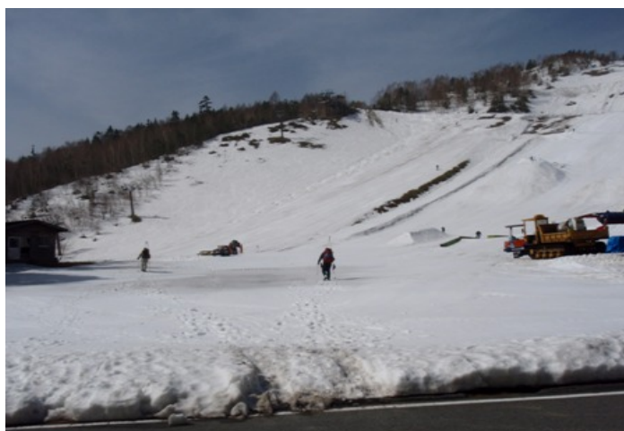
写真2 カモシカコースのゲレンデを行く

位ヶ原山荘は、前泊の人やバスで到着した人らでごった返していた。ほとんどの人は位ヶ原山荘から富士見岳や摩利支天岳の斜面に向けて直登している。我々は