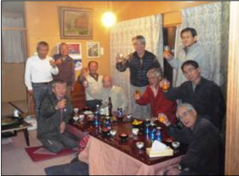
平成25年度総会が終わり乾杯！