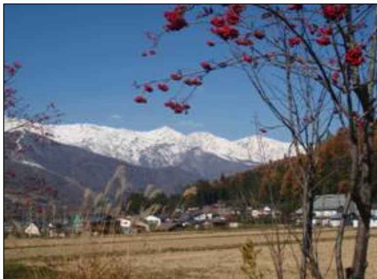
白馬は好天でした。