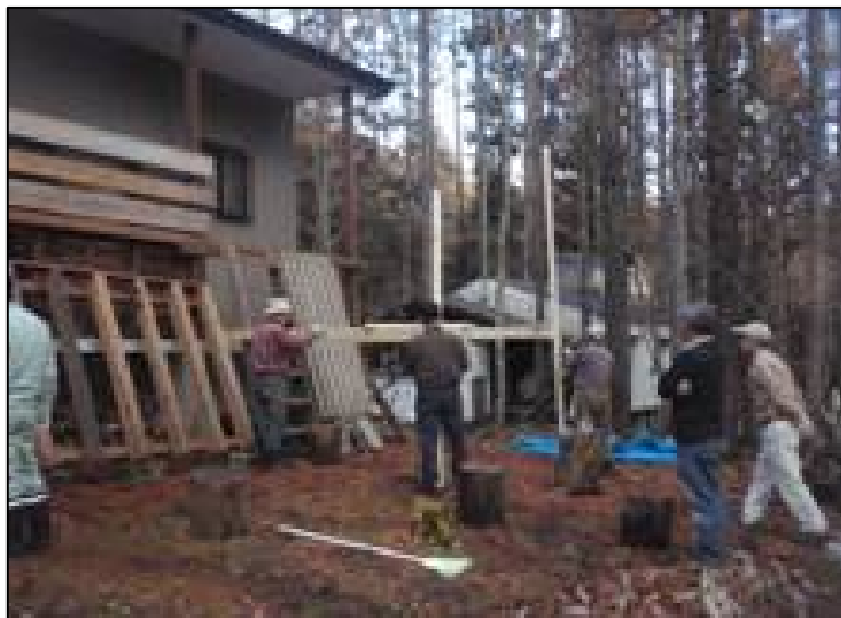
ベランダへのテラス増築のイメージ試作