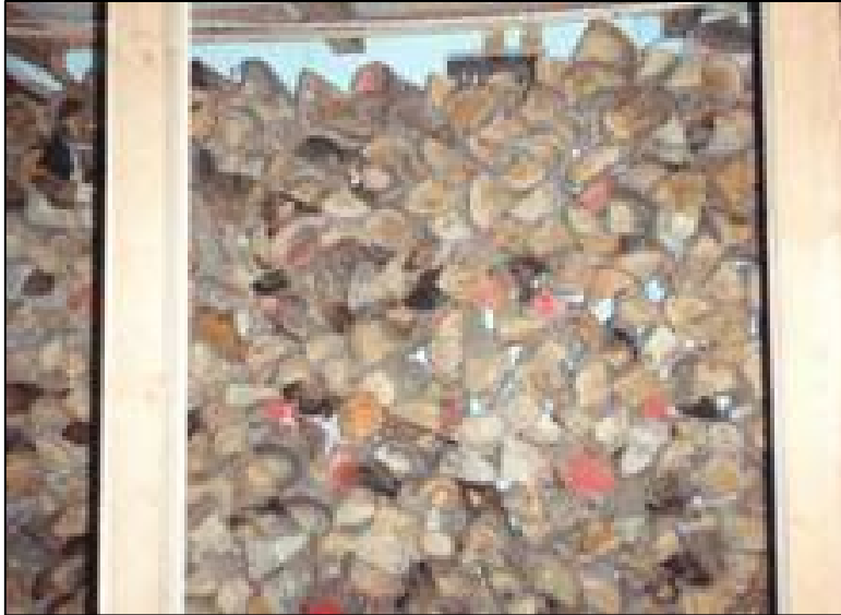
庭積みの薪を地下室に収納した。