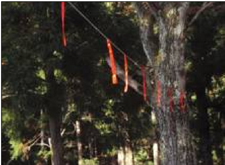
ラッセル車向けの赤旗の取付