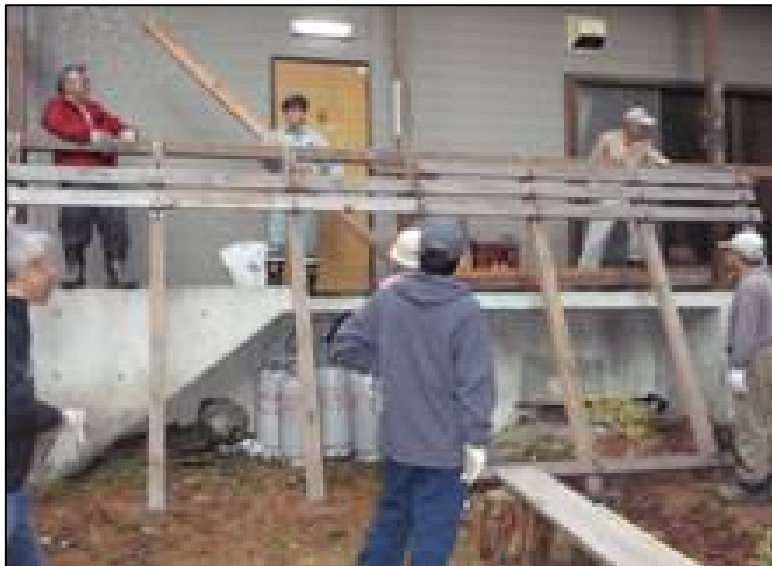
雪避けの柱組作業