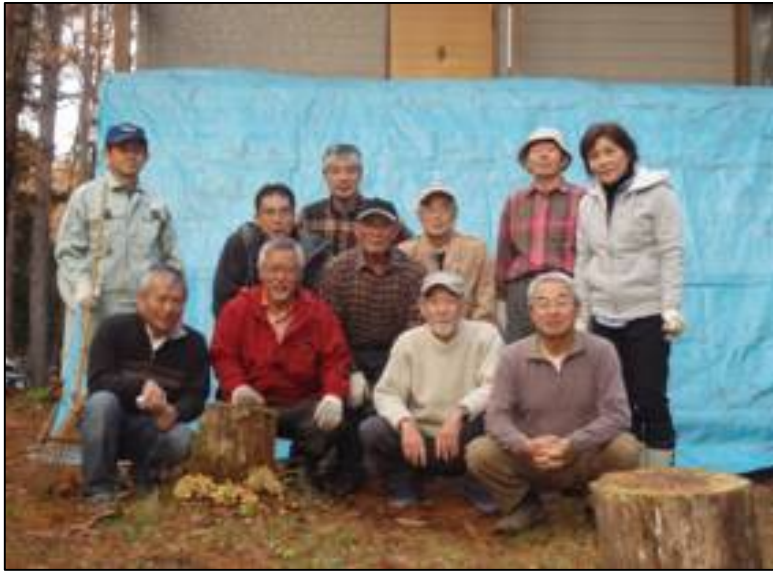
雪避け作業が終わりました。