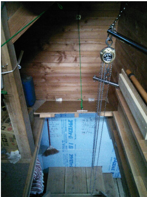
見え辛いですが紐で引上げ中です 閉鎖は逆の操作によります。