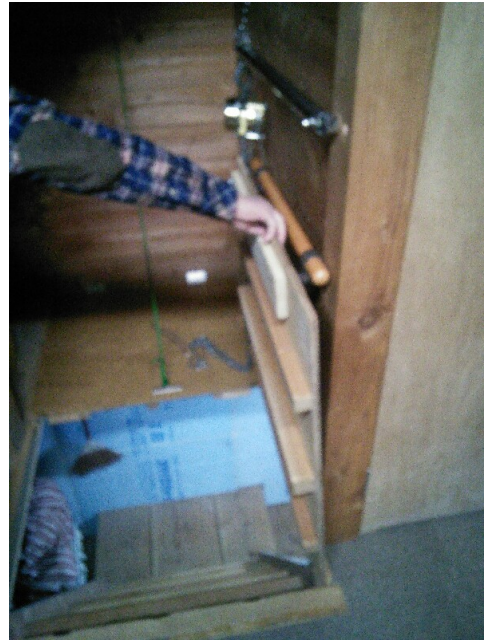
写真では固定紐はありませんが・・・