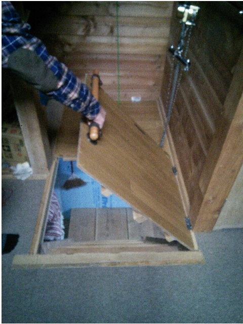
手前の蓋を持ち上げる 次に奥の蓋を緑の紐で引き上げます。