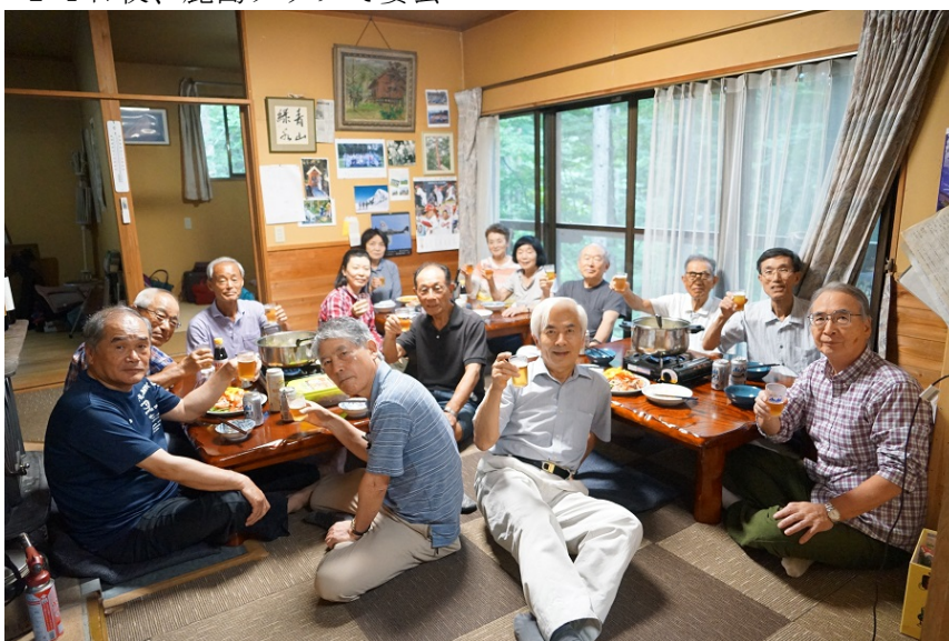
14日夜、鹿島クラブで宴会