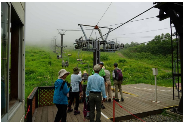
リフトに乗り換え