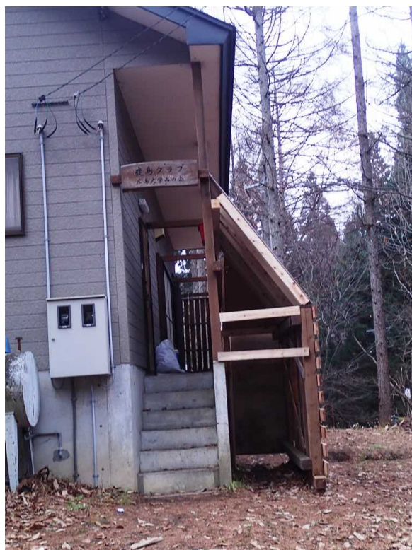
玄関側の雪囲い断面