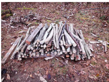
ツリーハウス用の手摺り子の採取