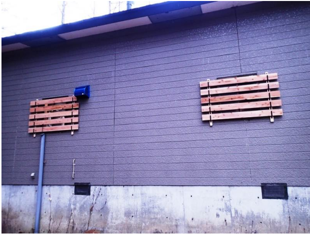
台所と洗面所の窓枠の雪囲い設置