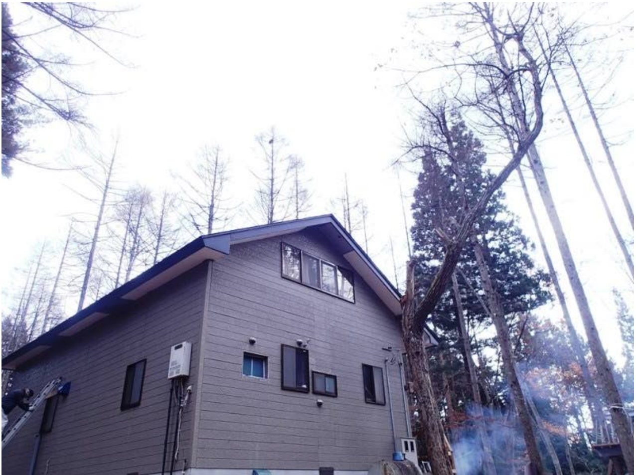
屋根にかかる栗の木の枝を伐採