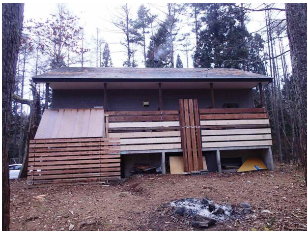
完成した新規雪囲い