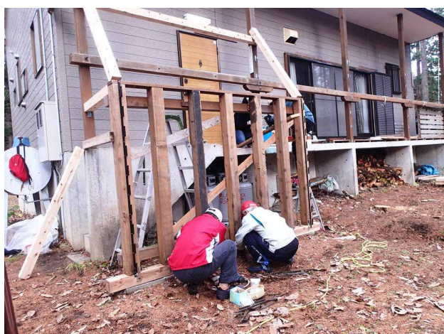
雪囲いの組立状況