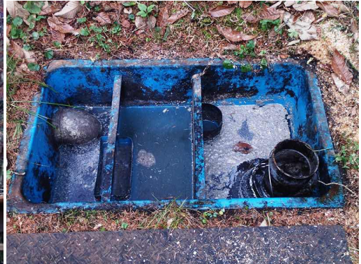
台所の排水柵の清掃