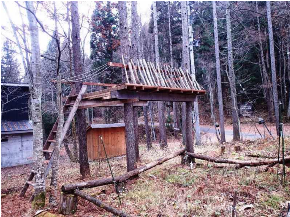
建設中のツリーハウス