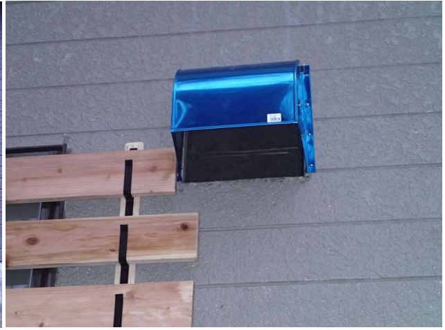
換気扇フードカバーの交換