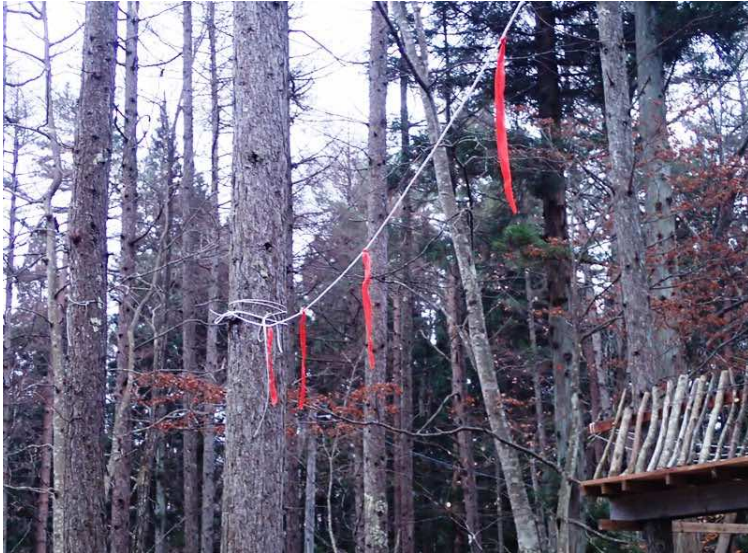
除雪境界に赤旗の設置