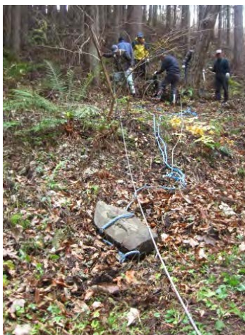
KCメンバー総出の安置作業