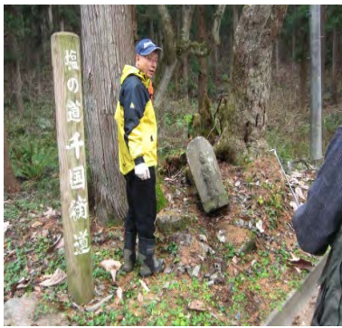
ここにもあるぞ!4体目