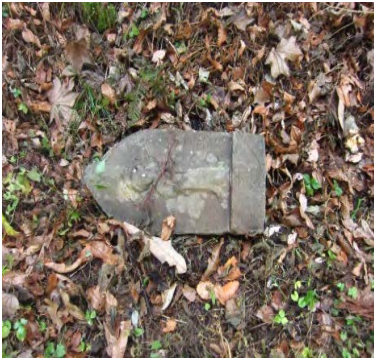
3体目：草叢に横たわる