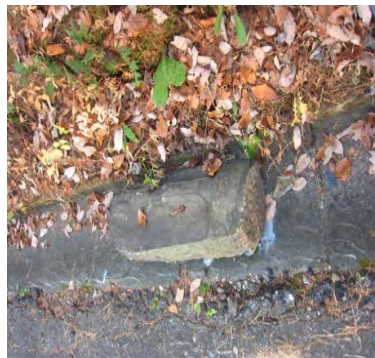
2体目 道端の溝に横たわる お地藏さん