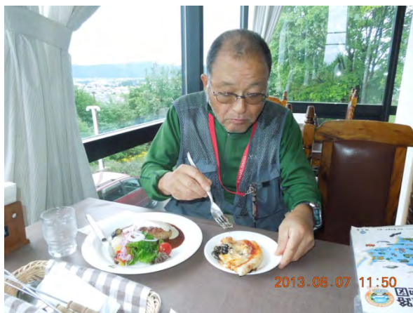
富良野ワイン工場レストランで昼食