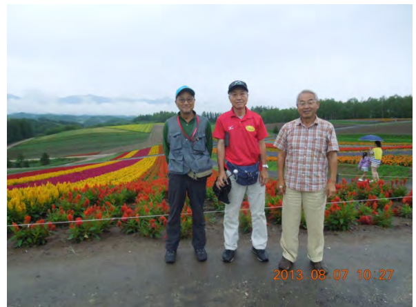
富良野四季彩の丘