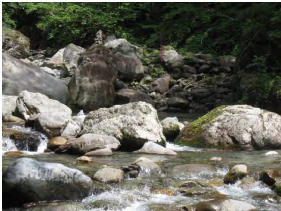
渡渉開始地点 (帰路は岩が半分まで水没していた)