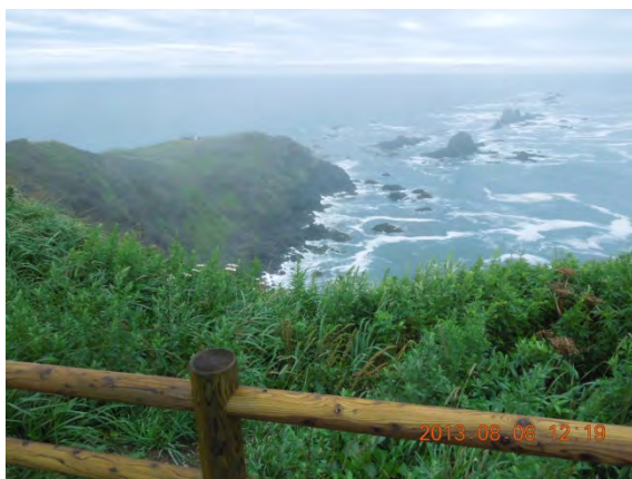
襟裳岬先端の岩礁