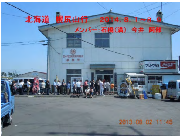
苫小牧港 マルトマ食堂