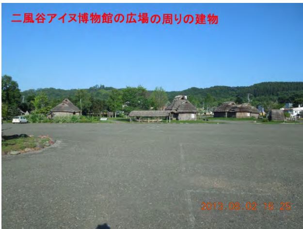
二風谷アイヌ博物館の広場の周りの建物