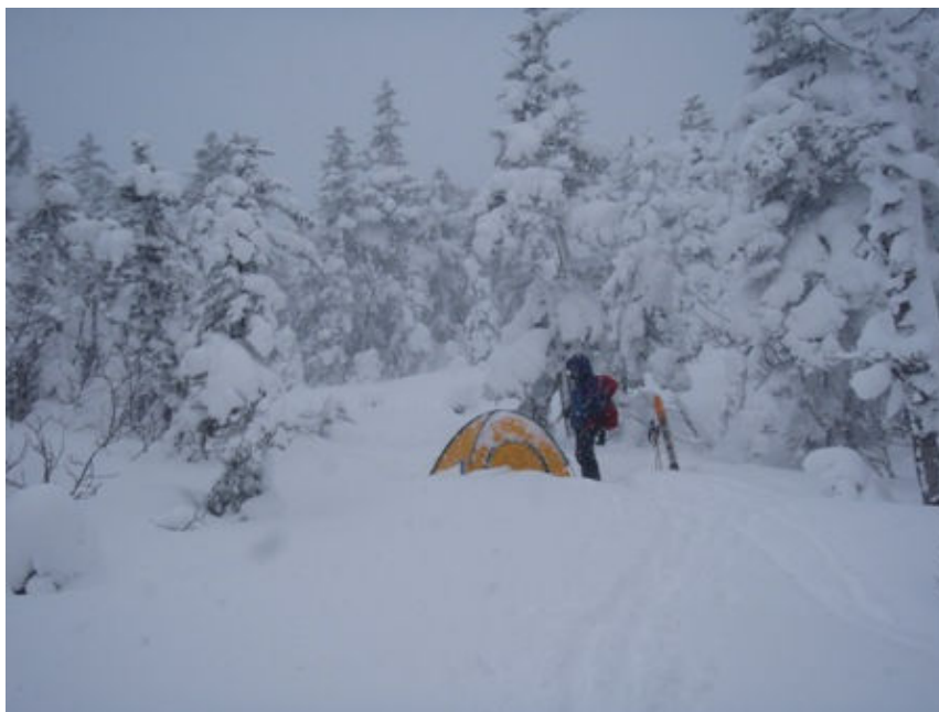
写真-4 新雪に覆われた BC 付近 (2250m)

夜半より雪。強くはないが終日降り続く。様子を見ていたが取り敢えず位ヶ原まで登ることにする。9:15 テントサイト発（写真-4）。雪の中順調にスキー登行。10:30 位ヶ原手前の急登着（写真-5）。位ヶ原東端着 11:10。風は余りないが降雪のため視界はきかず、早々に下る。今シーズン初の新雪スキーの感触だがまだまだ楽しめない。テントサイトを通り過ぎ一気に最終リフト基点にある三本滝ロッジまで下る。ロッジで水の補給（燃料の残り具合が心配で）と一休み（12:30）の後、最終リフト経由ベースキャンプに戻る。ベースキャンプ着 15:30。まだ時間が早いので青景さん購入の雪崩ビーコン Pieps DSP によるビーコン訓練を行う。さすが Pieps DSP は素晴らしい。何の問題も無く雪面下1mに埋めた私のビーコンを探し出す。