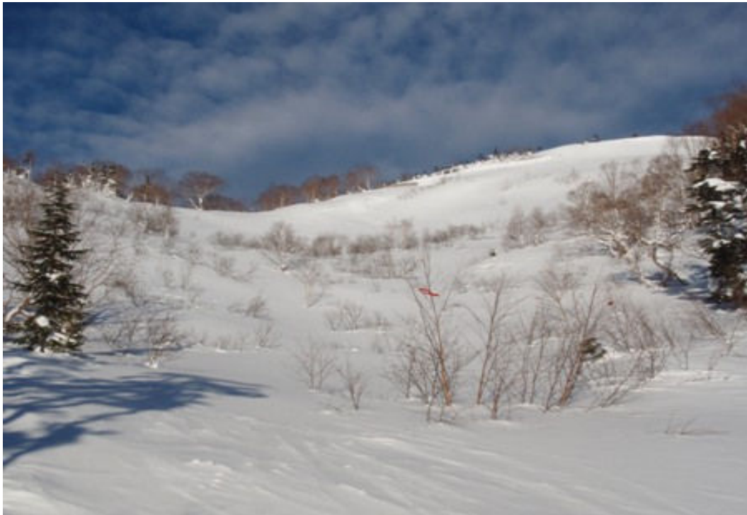
写真-7 位ヶ原東端の急斜面