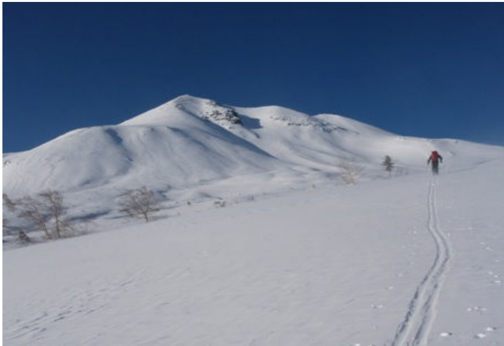
写真-8 肩ノ小屋を目指し、乗鞍岳を横目に位ヶ原を行く