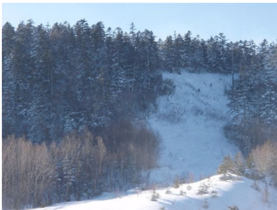
写真-3 かもしか平直上の急斜面の登り