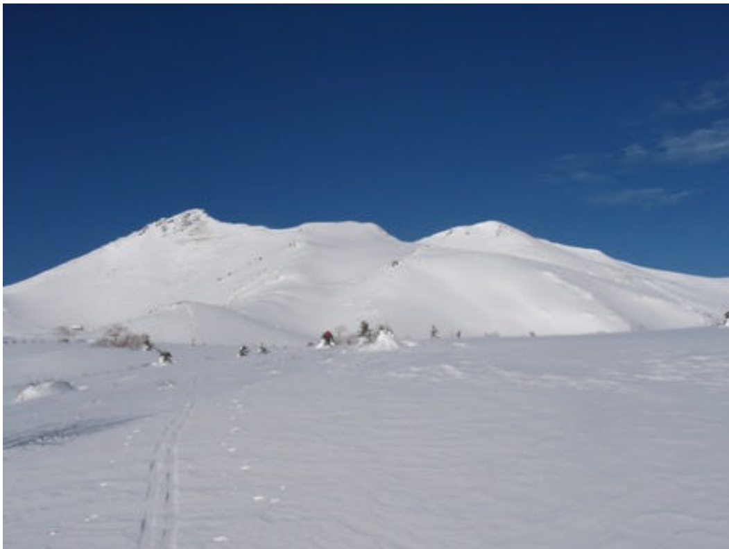
写真-9 氷の面が出ている位ヶ原を肩ノ小屋に向かう（正面は摩利支天岳）