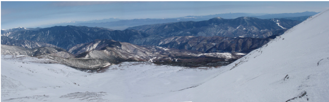
写真-1 乗鞍岳への登り途中から位ヶ原・乗鞍高原スキー場を望む