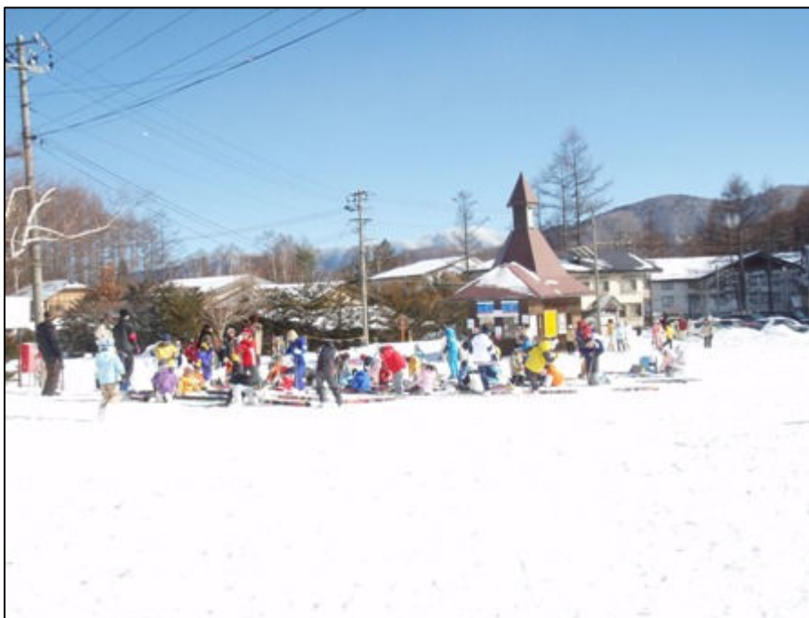
写真-2 乗鞍高原スキー場の賑わい

かもしか平の直上の雪壁を越えるのに、新雪の下が堅雪となっており難渋する（写真-2）。これをやっと乗り越え、その後は順調に進み2250mにベースを設営（16:20）。