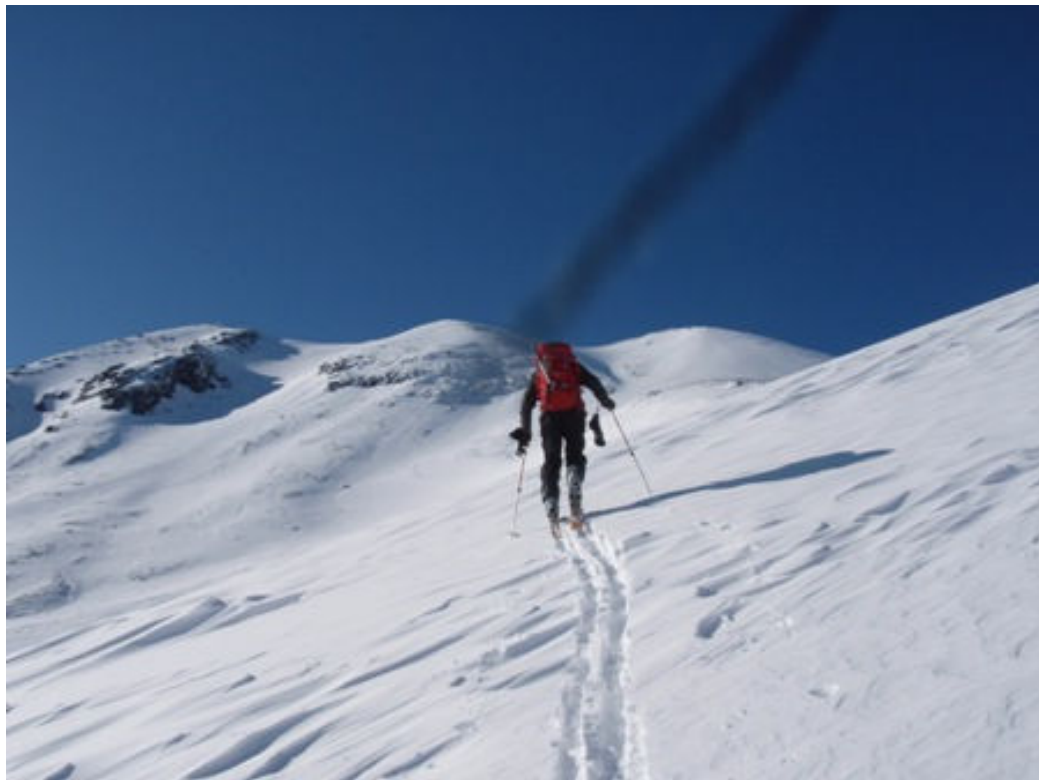
写真-10 肩ノ小屋への最後の登り