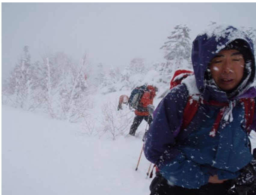
写真-5 降雪のなかを位ヶ原に向けシール登行