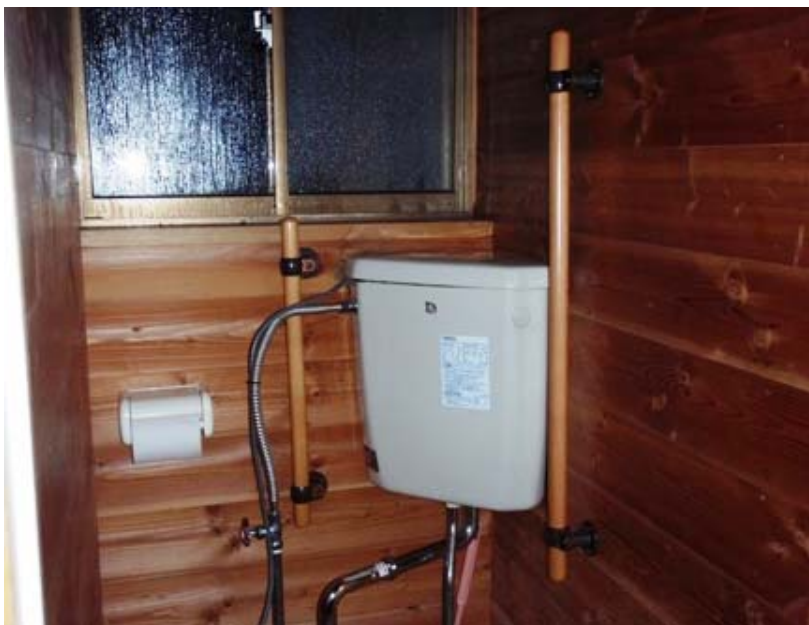
写真－10 和式トイレに設置した手摺