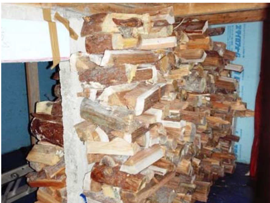
写真-8 地下室に搬入した薪