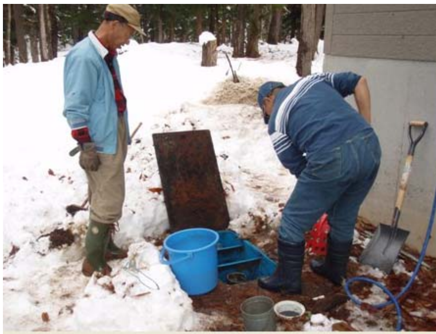
写真-6 排水ますの掃除