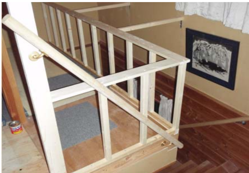
写真－9 2階に設置した階段手摺と安全柵を新設