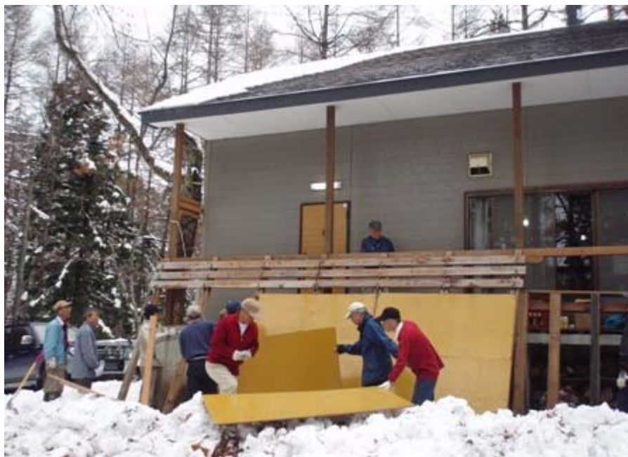
写真-5 防雪用の柵を設置