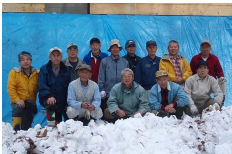
写真－2 屋外作業を終えて