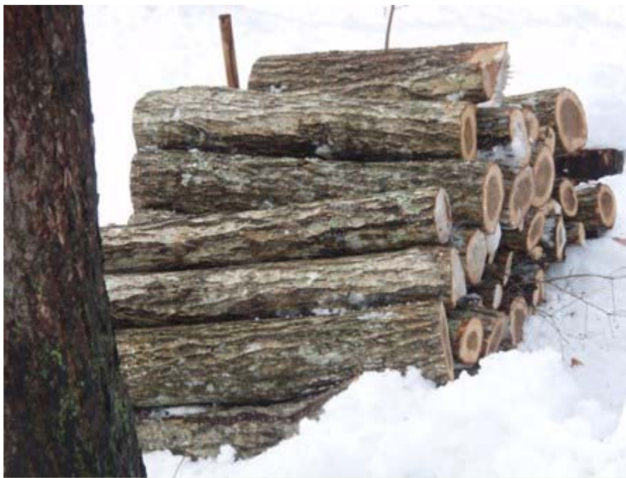
写真－１１ ホダ木用に伐採