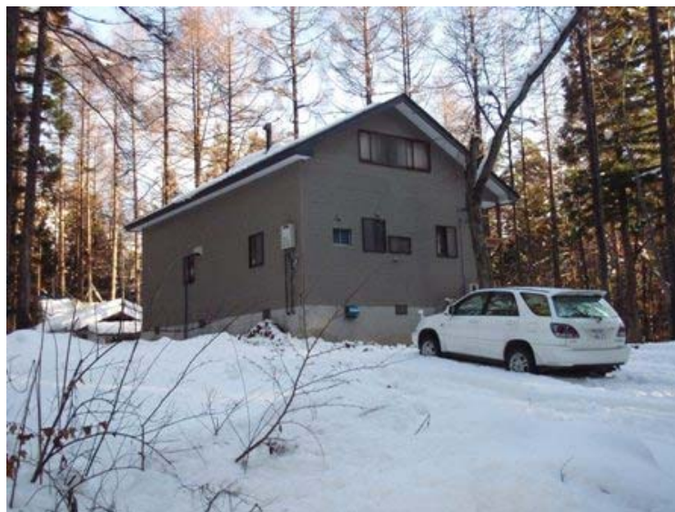
写真－1 早くも雪景色のKC

11月18日の寒波で日本海側では降雪があり、22日のKC周辺はすっかり冬景色となっていた（写真－1）。白馬47や八方尾根のスキー場は部分的にオープンしたようであるが、KC付近では30cm程度の積雪であったので、冬支度には間に合った。作業内容は以下の通りである。