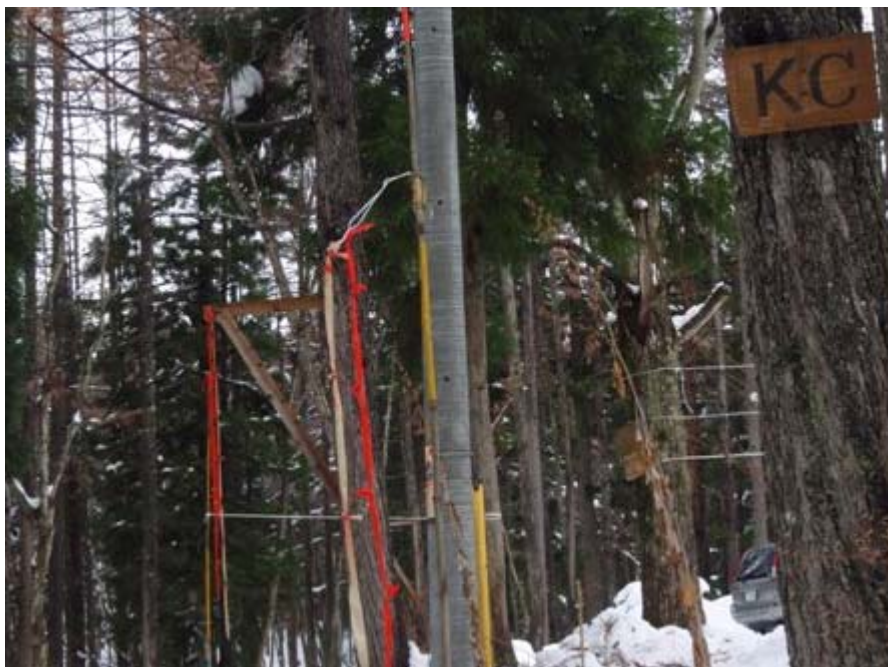
写真-7 道路境界に付けた赤旗