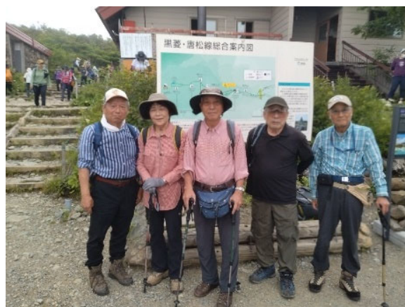
後藤さんと岸が交代で撮影。