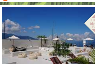
7 HAKUBA MOUNTAIN BEACH