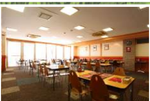
6 イタリアンレストラン「軽井沢プリモ」