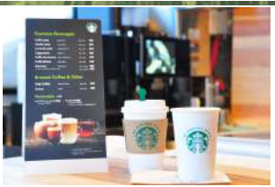
5 八方うさぎ平カフェ