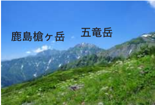
3 迫力の北アルプスの稜線