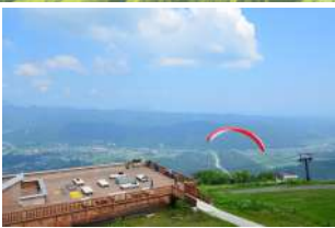
4 Corona Escape Terrace