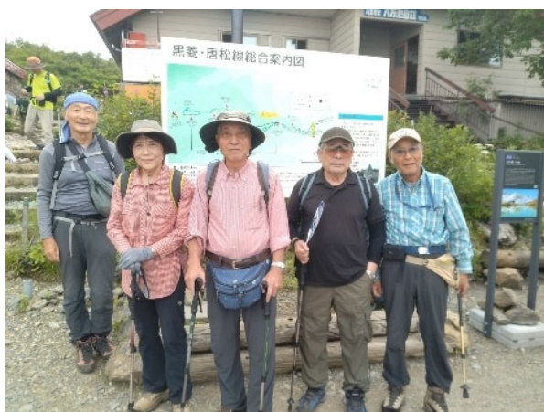
八方池山荘の出発点で記念撮影